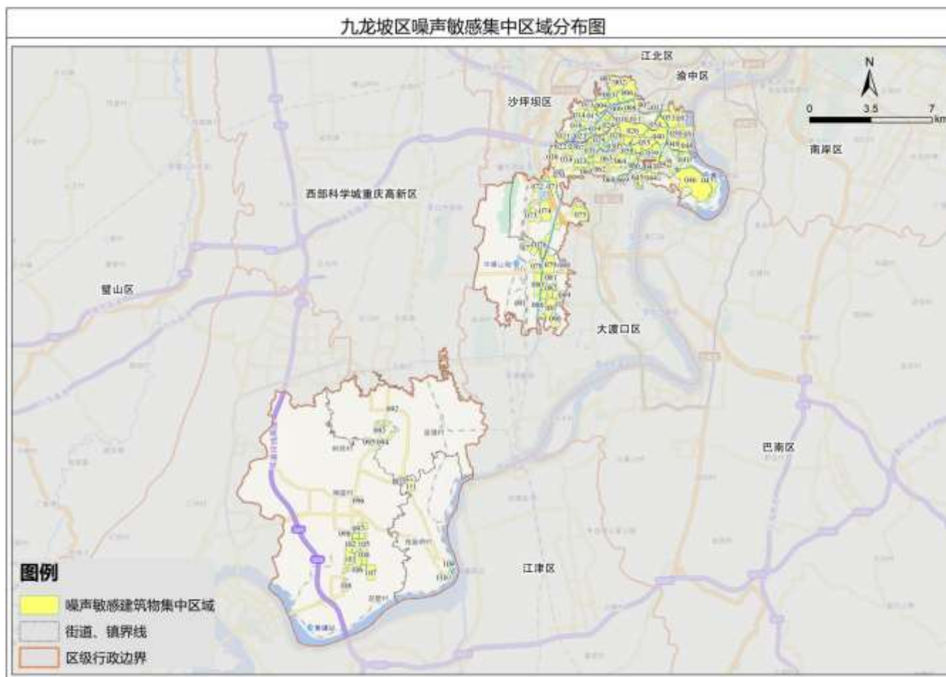
附图 1.九龙坡区噪声敏感建筑物集中区域分布图